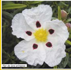
Flor de flor amarilla