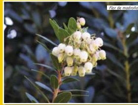
Flor de madroño